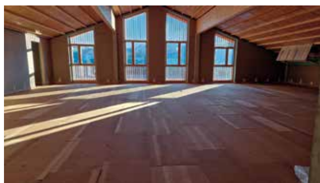
Die neuen Räumlichkeiten für den Trachtenverein im Neubau Haus für Kinder (Januar 2025)

Die Kosten dürften sich ohne die o.g. Verbesserungen in der Aula auf ca. 361.000 Euro belaufen. Die Förderhöhe ist im weiteren Planungsprozess mit der Regierung von Oberbayern abzustimmen. Das Planungsbüro wurde gebeten, ein Angebot bis zur Entwurfsplanung vorzulegen. Sodann wird die Verwaltung beauftragt, das Planungsverfahren fortzuführen. In der weiteren Planung sind auch Verbesserungsmaßnahmen hinsichtlich Glasdach, Umrüstung Beleuchtung und Raumakustik mitzubedenken.