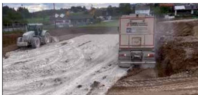
September 2023: Aushub und Bodenverbesserung