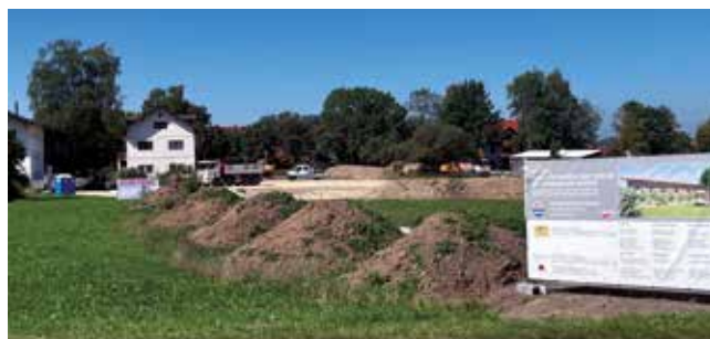
Baustellenansicht Anfang September

Auf amerang.de wird der Fortschritt des Bauprojekts laufend dokumentiert.