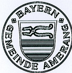
Augustin Voit 1. Bürgermeister