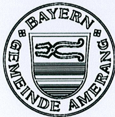
Augustin Voit 1. Bürgermeister